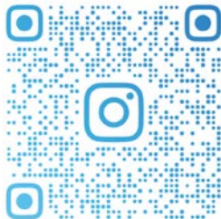
Fans de las Inversiones

Descubra estas dos atractivas opciones para comenzar a diversificar.